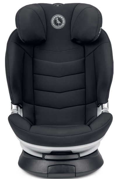
Niki Next 100-150 cm