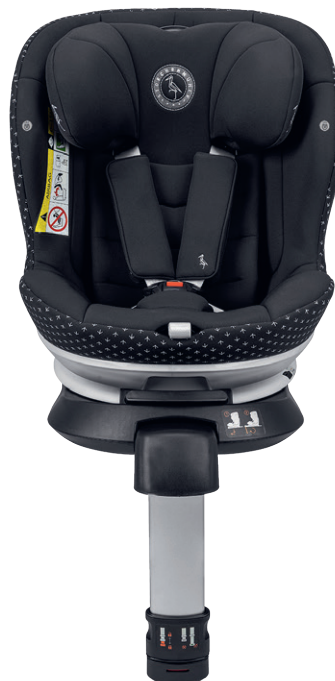
Niki Start M Reboard von 61 bis 105 cm