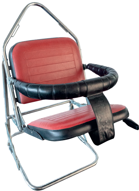
Erster Kinderautositz Niki von 1963

Wir schreiben die Geschichte der Autokindersitze neu - mit der Wiederbelebung von Storchmühle. Nach einer intensiven und leidenschaftlichen Entwicklungsphase kommt noch dieses Jahr die erste Produktlinie auf den Markt.