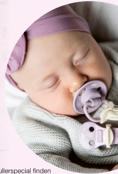
Unser Schnullerspecial finden Sie auf den Seiten 44 und 45.