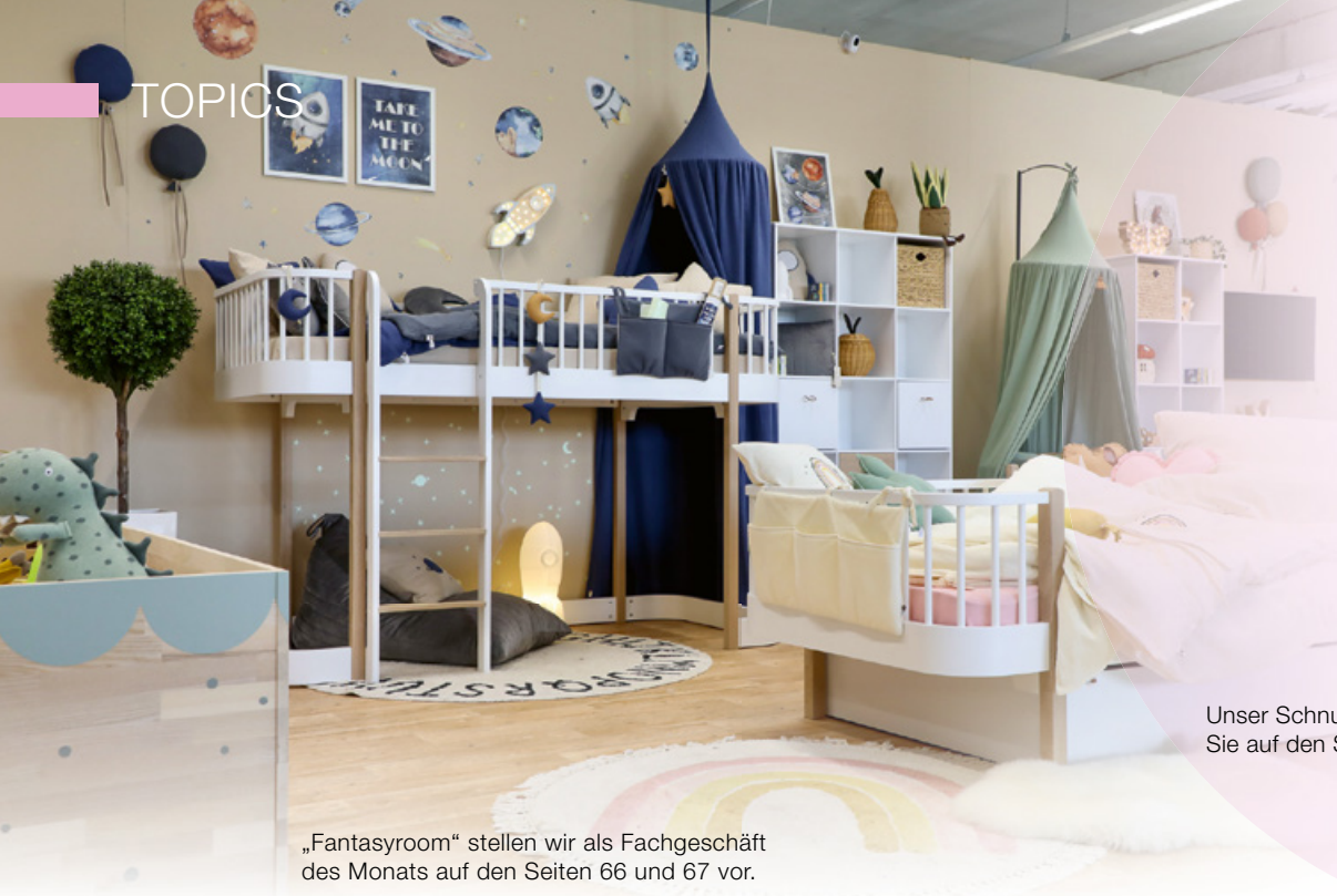
„Fantasyroom“ stellen wir als Fachgeschäft des Monats auf den Seiten 66 und 67 vor.